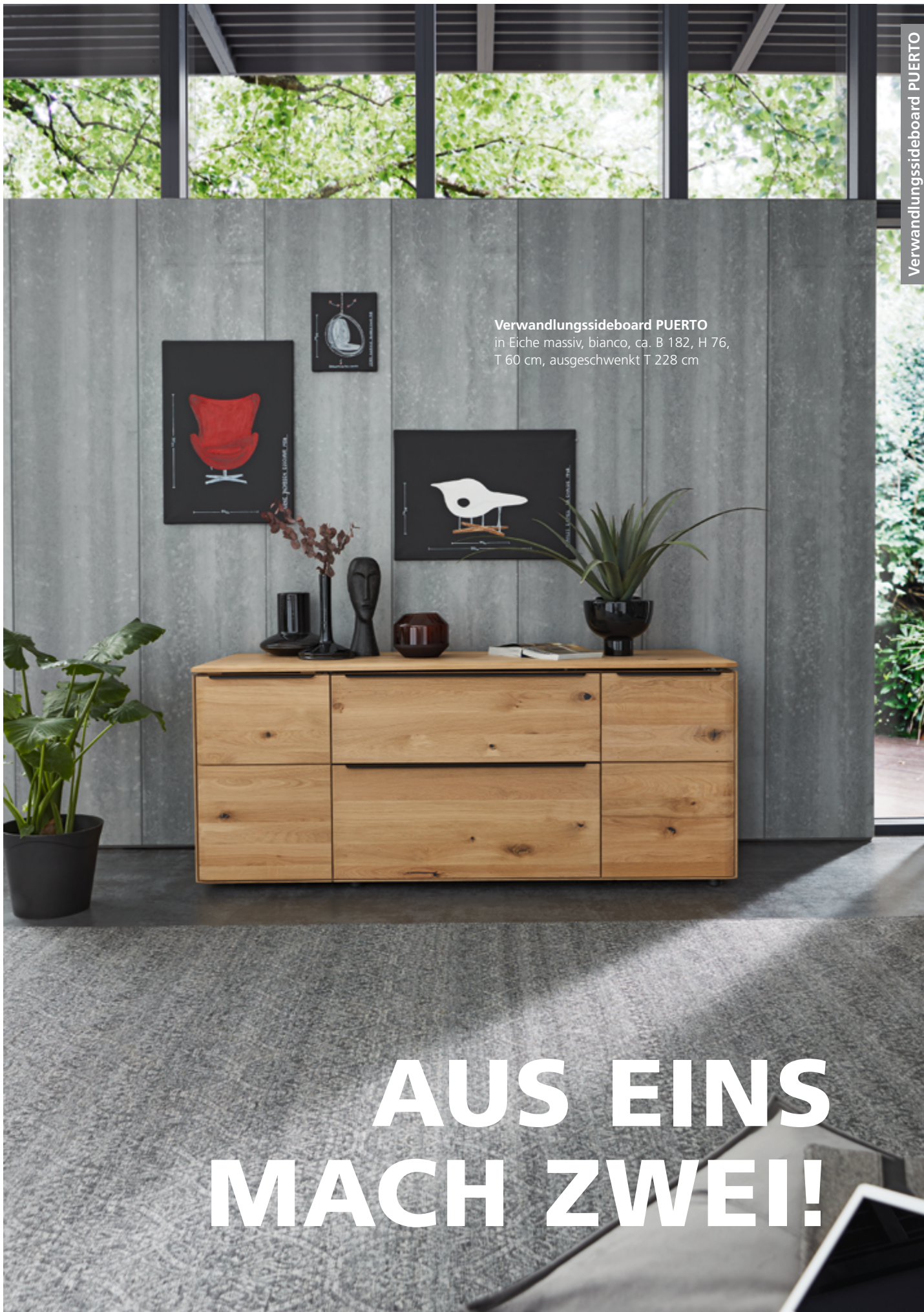
Verwandlungsideboard PUERTO in Eiche massiv, bianco, ca. B 182, H 76, T 60 cm, ausgeschwenkt T 228 cm