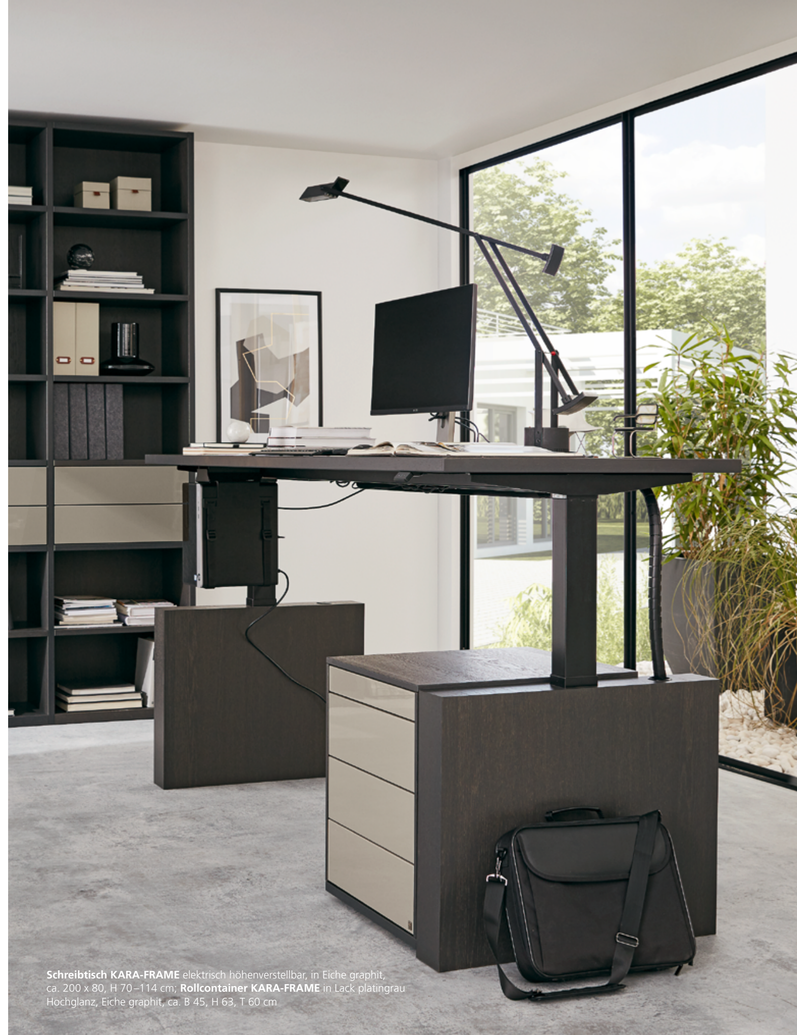
Schreibtisch KARA-FRAME elektrisch höhenverstellbar, in Eiche graphit, ca. 200 x 80, H 70–114 cm; Rollcontainer KARA-FRAME in Lack platingrau Hochglanz, Eiche graphit, ca. B 45, H 63, T 60 cm.