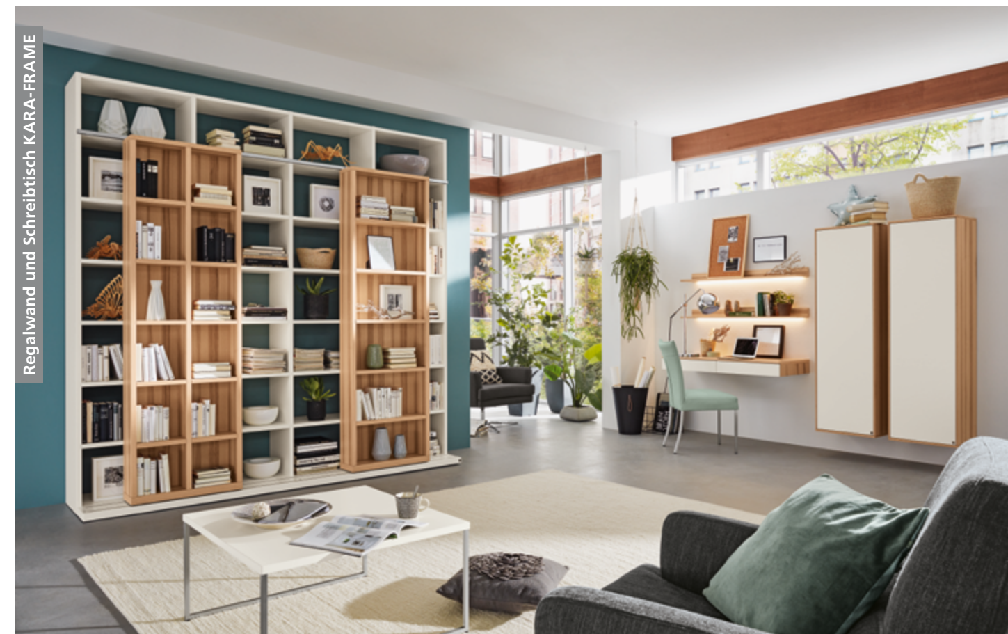
Regalwand KARA-FRAME in Kernesche, Lack weiß, ca. B 255, H 251, T 55 cm; Couchtisch KARA-FRAME in Lack weiß, ca. 75 x 75, H 40 cm

kastenzeile beispielsweise reicht als Schreibtisch oft völlig aus und bietet außerdem genügend Stauraum für die BüROUTENSILIEN. Dazu eine maßgeschneiderte Regalwand und vielleicht noch einige geschlossene Schränke – fertig ist eine hochattraktive Zusammenstellung, bei der Wohnen und Arbeiten fließend ineinander übergehen. Außerdem haben Sie die Wahl zwischen vielen frischen Lack- und Holzoberflächen. Machen Sie aus Ihrem Homeoffice eine Lifestylezone, in der Sie sich rundherum wohlfühlen.