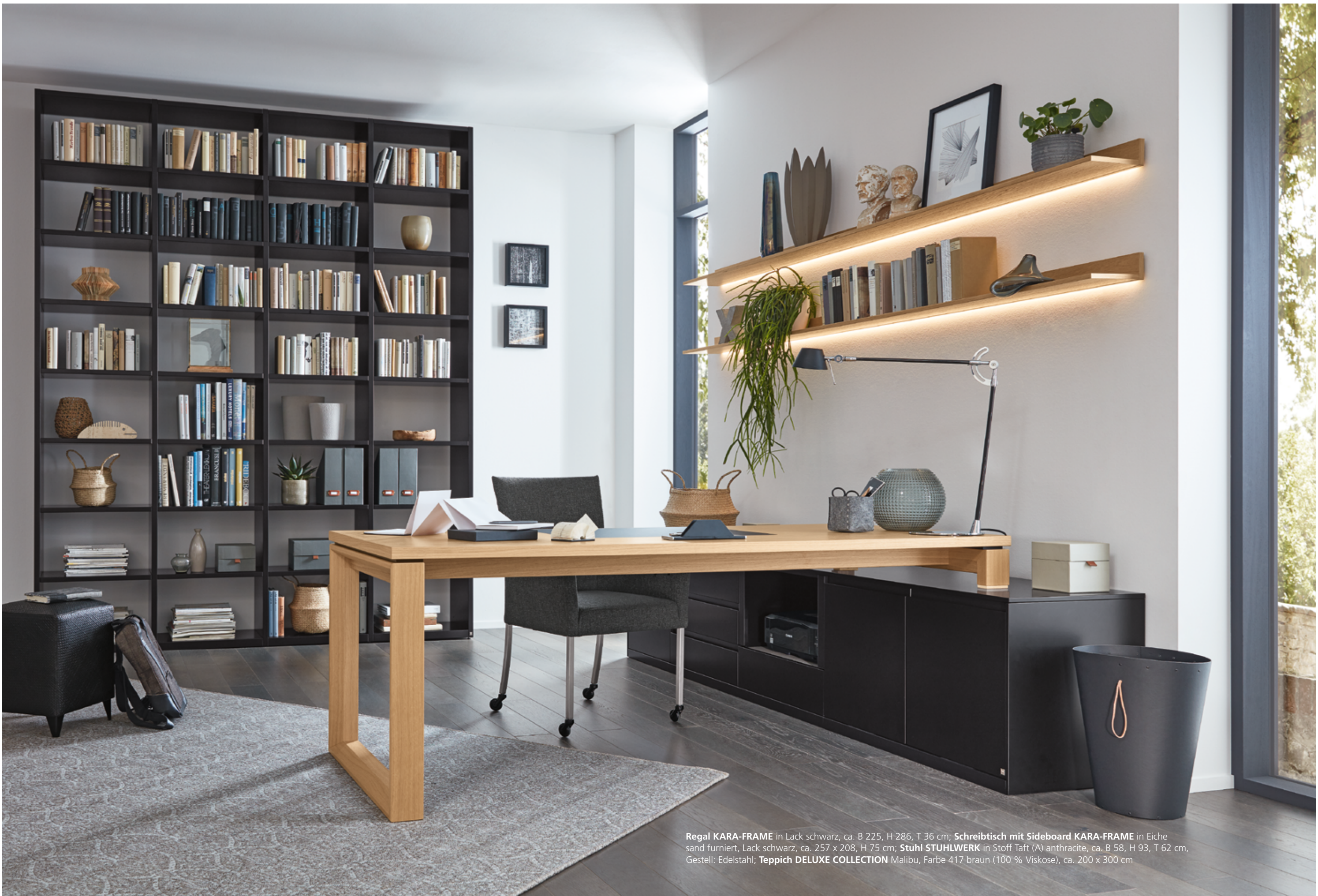
Regal KARA-FRAME in Lack schwarz, ca. B 225, H 286, T 36 cm; Schreibtisch mit Sideboard KARA-FRAME in Eiche sand furniert, Lack schwarz, ca. 257 x 208, H 75 cm; Stuhl STUHLWERK in Stoff Taft (A) anthracite, ca. B 58, H 93, T 62 cm, Gestell: Edelstahl; Teppich DELUXE COLLECTION Malibu, Farbe 417 braun (100 % Viskose), ca. 200 x 300 cm