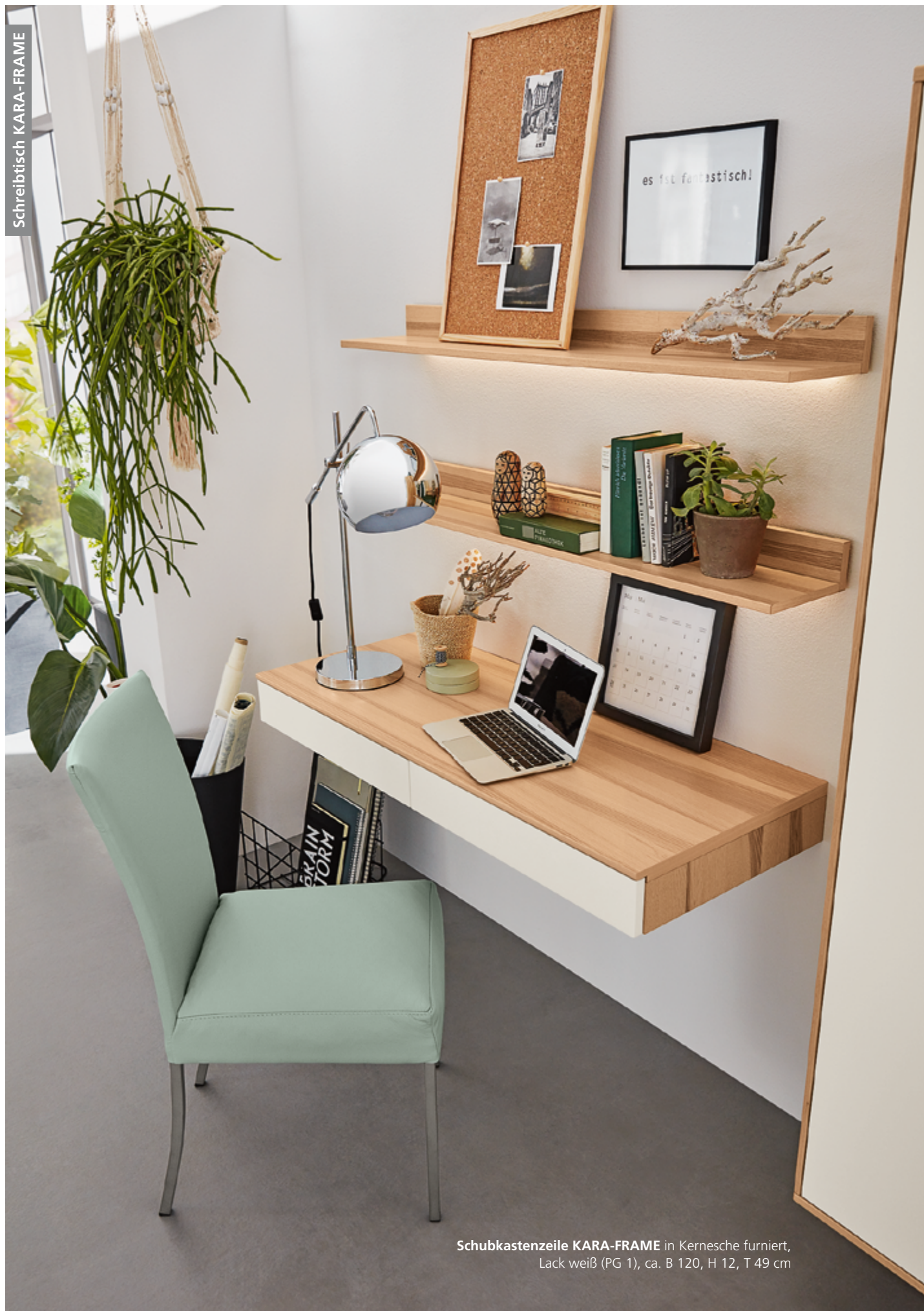
Schubkastenzeile KARA-FRAME in Kernesche furniert, Lack weiß (PG 1), ca. B 120, H 12, T 49 cm