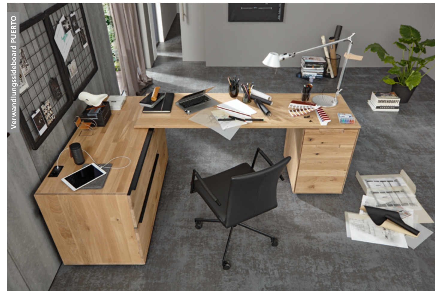
Stuhl HELMOND in Leder Toledo (1) nero, Gestell schwarz mit Rollen, ca. B 55, H 91, T 58 cm

praktischen Kabeldurchlass ausgestattet. Damit Ihrem Laptop, Tablet oder Smartphone nie der Saft ausgeht, ist der Oberboden mit einer Steckdose und zwei USB-Ladeanschlüssen lieferbar. Und wenn die Arbeit getan ist? Dann lässt sich der Schreibtisch mit wenigen Handgriffen wieder in ein attraktives Sideboard verwandeln – und vom Homeoffice ist nichts mehr zu sehen.